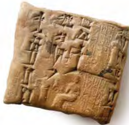
Tablette dans son enveloppe , III e dynastie d'Ur, règne de Shulgi (2095-2042 av J.-C.). Argile 5,7 x 5,1 x 2,9 cm N° inv. MB410 Fonds ancien de l'Université