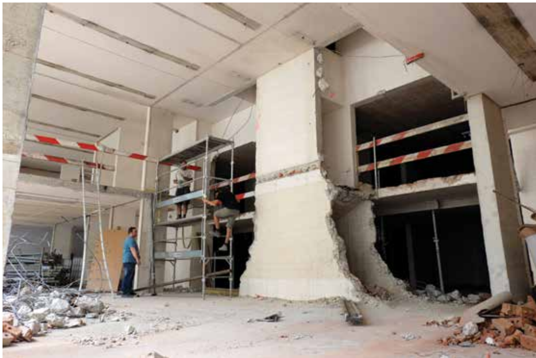
L'entrée du futur Musée!