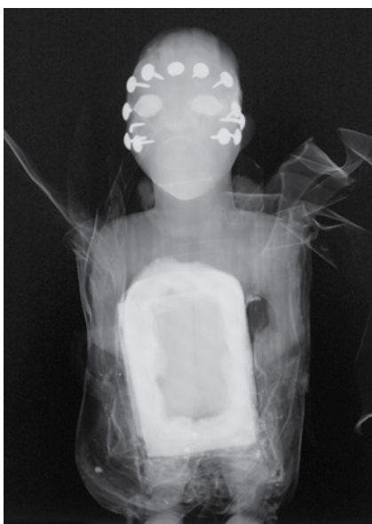
Fig. 3 a et b

Statue à pouvoir Nkisi phodi ( Phodi di vola ), Yombe. République démocratique du Congo. 26x20x17 cm. Inv.n°A6. Fonds ancien de l'Université.