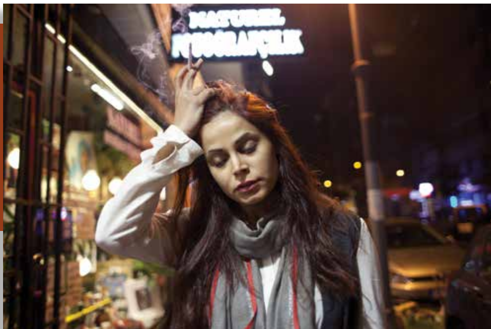
Ahmet Polat. Smoking girl , Osmanbey Istanbul 2014

Deux expositions phare ont lieu au Palais des Beaux-Arts de Bruxelles