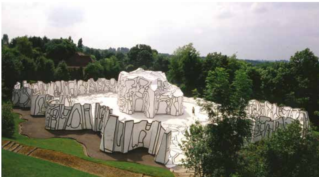
Jean Dubuffet, Closerie et Villa Falbala, 1970 - 1973 Fondation Dubuffet

est une œuvre qui réunit quatre mouvements artistiques : Dada, Nouveau réalisme, Art cinétique, Art brut. Le colosse abrite en son centre un univers surprenant, une construction insolite qui démarra en 1969.