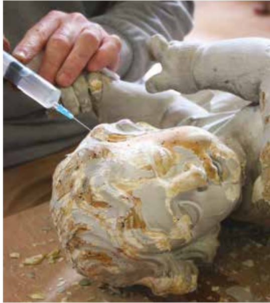
Restauration d'œuvre d'art