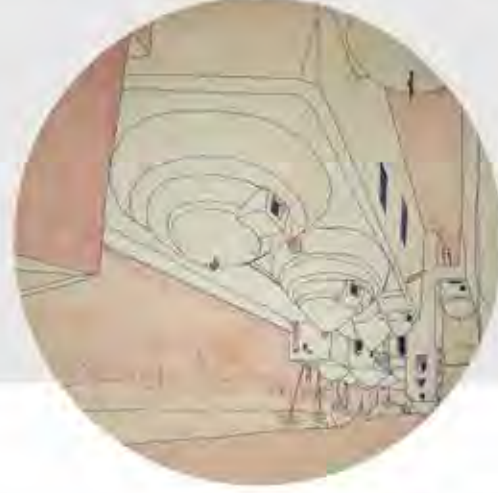
Croquis des églises de Saint-Antoine et des Apôtres au monastère de Saint-Antoine. 1951