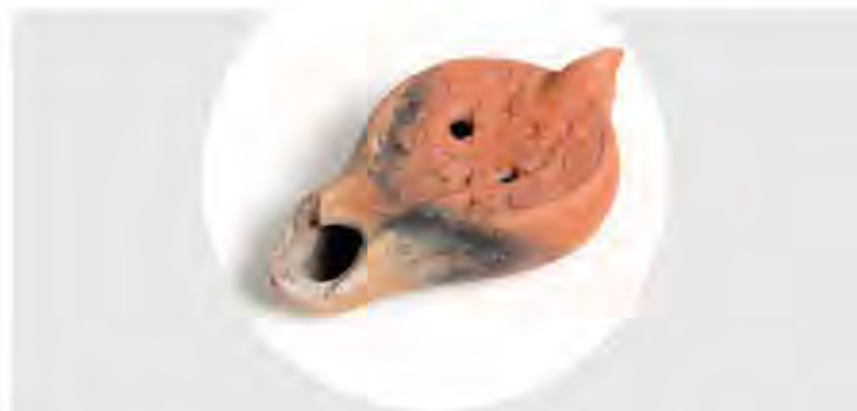
Lampe avec un chrisme , fabrication carthaginoise (?), 5 e -6 e s. apr. J.-G. Terre cuite | Musée L | Legs Chabot

We kennen meer dan 60 christelijke catacomben in Rome en 6 joodse catacomben. Deze werden gebruikt voor begravenissen tussen de 2 e en 5 e eeuw n.C. Na deze tijd raakten ze langzaam in onbruik, en velen werden volledig ontoegankelijk. Pas in de 15 e eeuw werd nieuw leven in de catacomben geblazen. Systematische archeologische opgravingen zouden echter pas in de tweede helft van de 19 e eeuw beginnen.