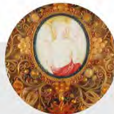
Reliquaire de saint Sébastien (détail), Europe, 18 e -19 e s. Os, bois, verre et papier | Musée L | Donation Boyadjian

Een reeks ontdekkingen in de 15 e eeuw leidde tot een hernieuwde belangstelling voor de catacomben en het fervent verzamelen van martelaarsrelikwieën door bezoekers. Een eeuw later zou een pauselijk decreet de chaotische opgraving van de overgebleven martelaren inluiden. Dit zou echter allemaal veranderen in 1851 toen de Christelijke Archeologie als discipline werd ontwikkeld onder toezicht van de Pauselijke Commissie voor Heilige Archeologie.