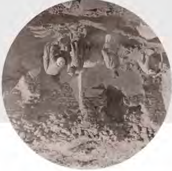
Travailleurs anonymes à Dier el Gizaq, 1947-1948 Négatif