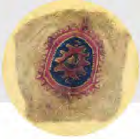
Orbiculus (medaillon) d'un textile copte (détail), 3 e -4 e s. apr. J.-C. Laine | Musée L